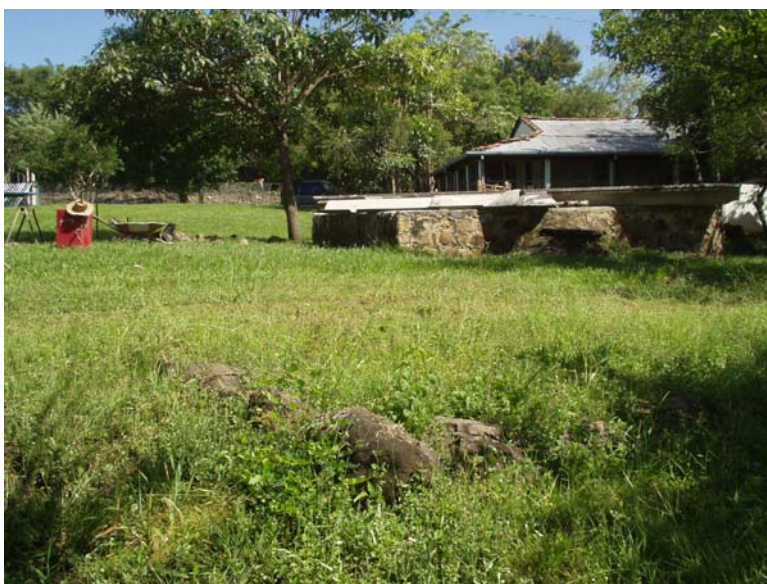
FIGURA 5: La Estructura P-32. Al fondo se observan el cimicento de piedra construida en los años setenta y la casa de Cihuatán.

Una plataforma delimitada por hileras de piedras pequeñas (de unos 20-30cm en diámetro). La porción visible tiene forma de “L”, ya que incluye una esquina.