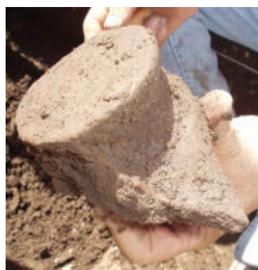
FIGURA 6 Orejera de Tláloc del nivel 2.