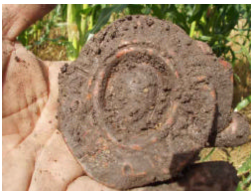
FIGURA 5 Ojo de Tláloc del nivel 2.