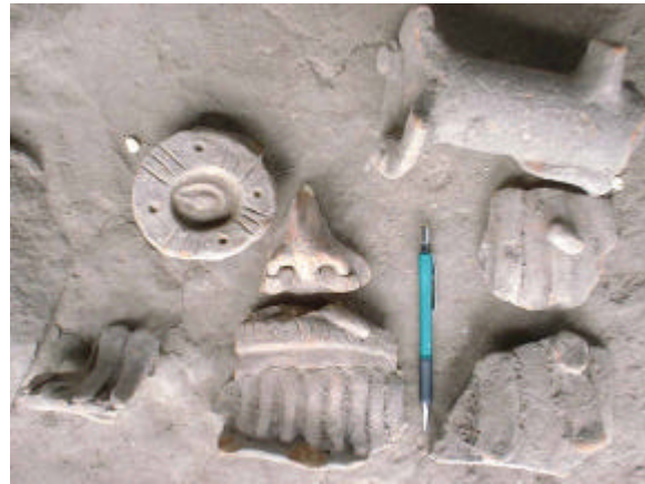
FIGURA 2 Tiestos de efigies de Tláloc recuperados por el Sr. Mina.

El 15 de enero, 2002, con la ayuda del Sr. Mina, Paul Amaroli marcó el lugar del hallazgo con GPS y una estaca. En ese momento, no había tiestos visibles en este punto, el cual se indica en la Figura 1 con una cruz roja según medición de GPS (aparece sobre el trazo preliminar de estructuras en base a una fotografía aérea de 1996). Las coordenadas de GPS son: 254999mE / 1540700mN (UTM, datum WGS84). Posteriormente el Sr. Mina puso piedras alrededor de la estaca para protegerla al arar y al sembrar el maíz que actualmente cubre esta zona.