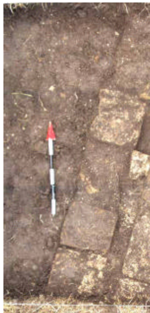
FIGURA 4 Vista vertical de la construcción de bloques de toba. La flecha indica el norte, y los incrementos son de 10cm.